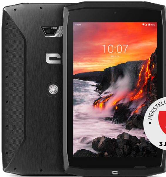
CORE-T4 CHF 539