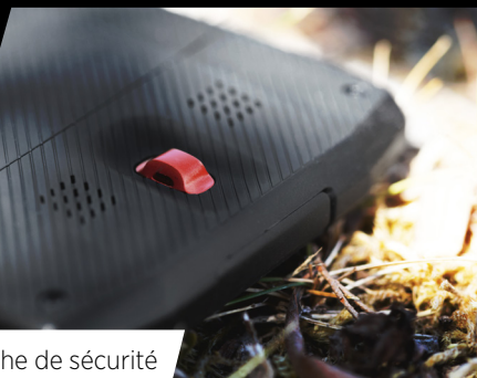
Attache de sécurité