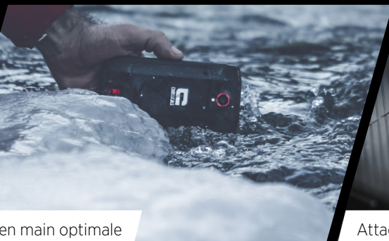
Prise en main optimale