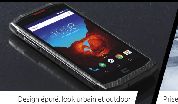
Design épuré, look urbain et outdoor

LE TREKKER-X3 EST LE SMARTPHONE QUI NE VOUS LÂCHERA PAS ET QUE VOUS NE LÂCHEREZ PLUS !