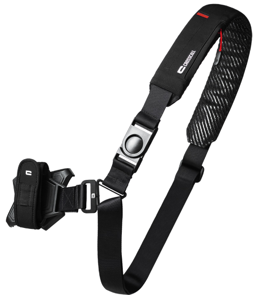
X-STRAP 59,99€ TTC