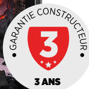
CORE-T4 499,99€ TTC